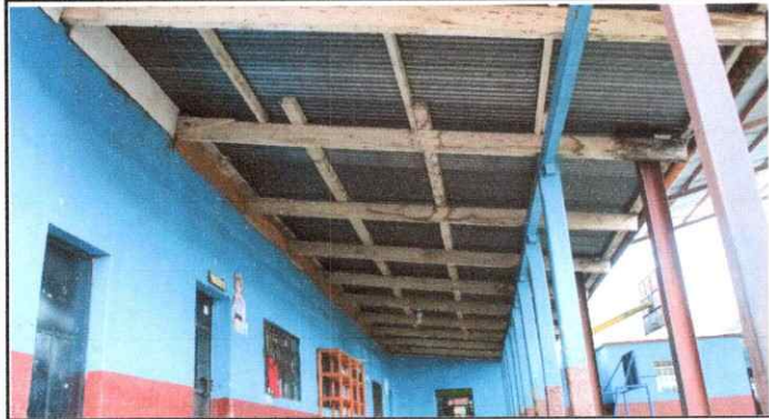
Foto 1: SUSTITUCIÓN DE LÁMINAS Y ESTRUCTURAS METÁLICAS POR DETERIORO