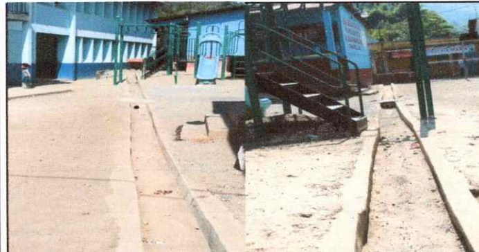
Foto 5: SUSTITUCIÓN DE REJILLAS EN CUNETAS POR DETERIORO EN ENTRADA AL ESTABLECIMIENTO.